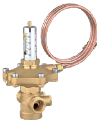
АРТ-R Ду 15-50